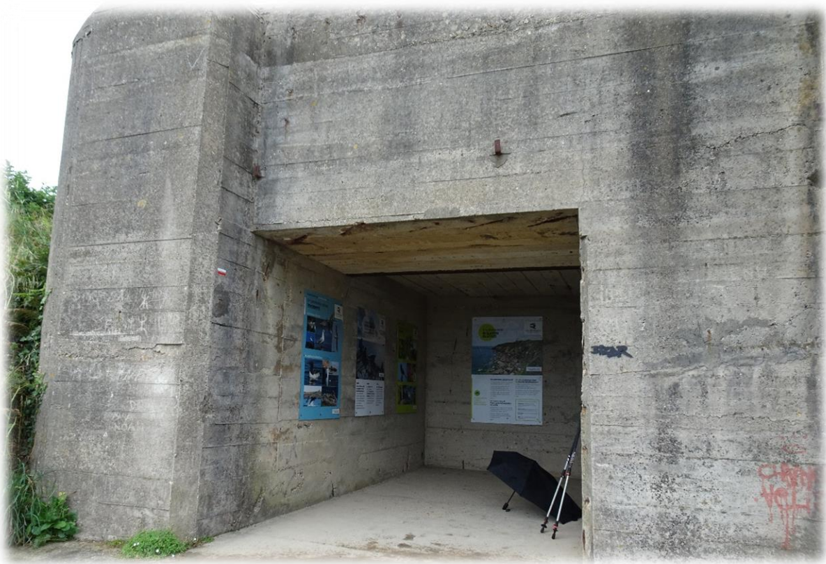
Sommige bunkers zijn toegankelijk. Deze leert ons dat er hier scholen zeehonden en dolfijnen zitten.