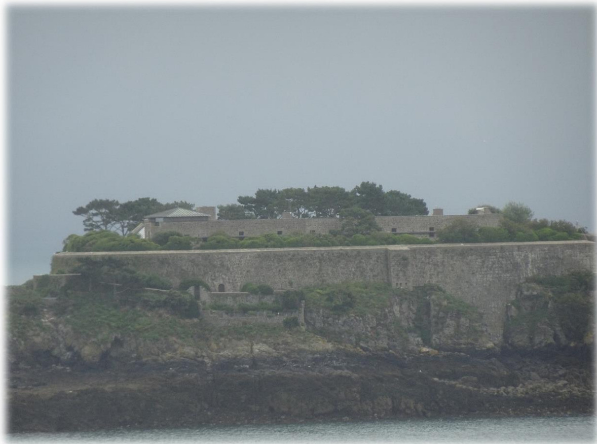
Het Île des Rimains ligt ongeveer 700 m ten oosten van de Pointe de la Chaîne, aan het einde van de Grande Rade de Cancale, die de baai van Mont Saint-Michel in het westen beëindigt.