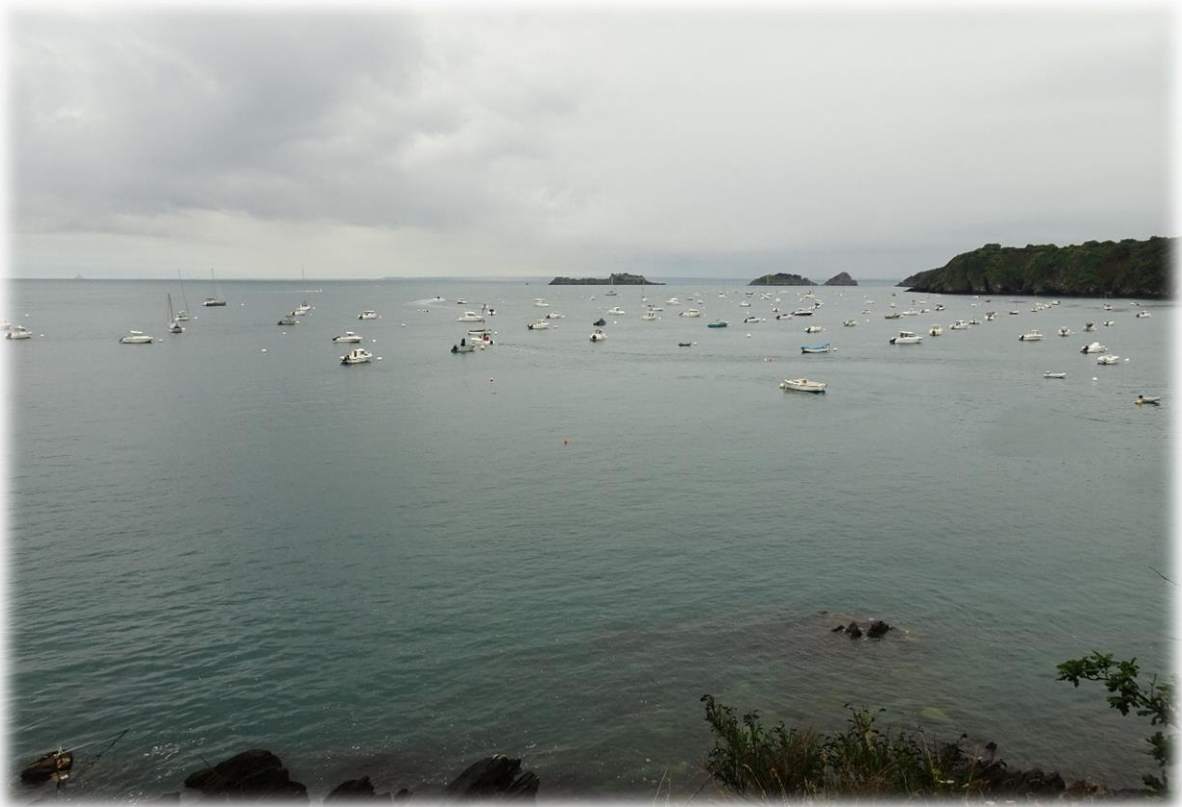
Het ene bootje na het andere wordt met een aanhangwagen aangebracht.